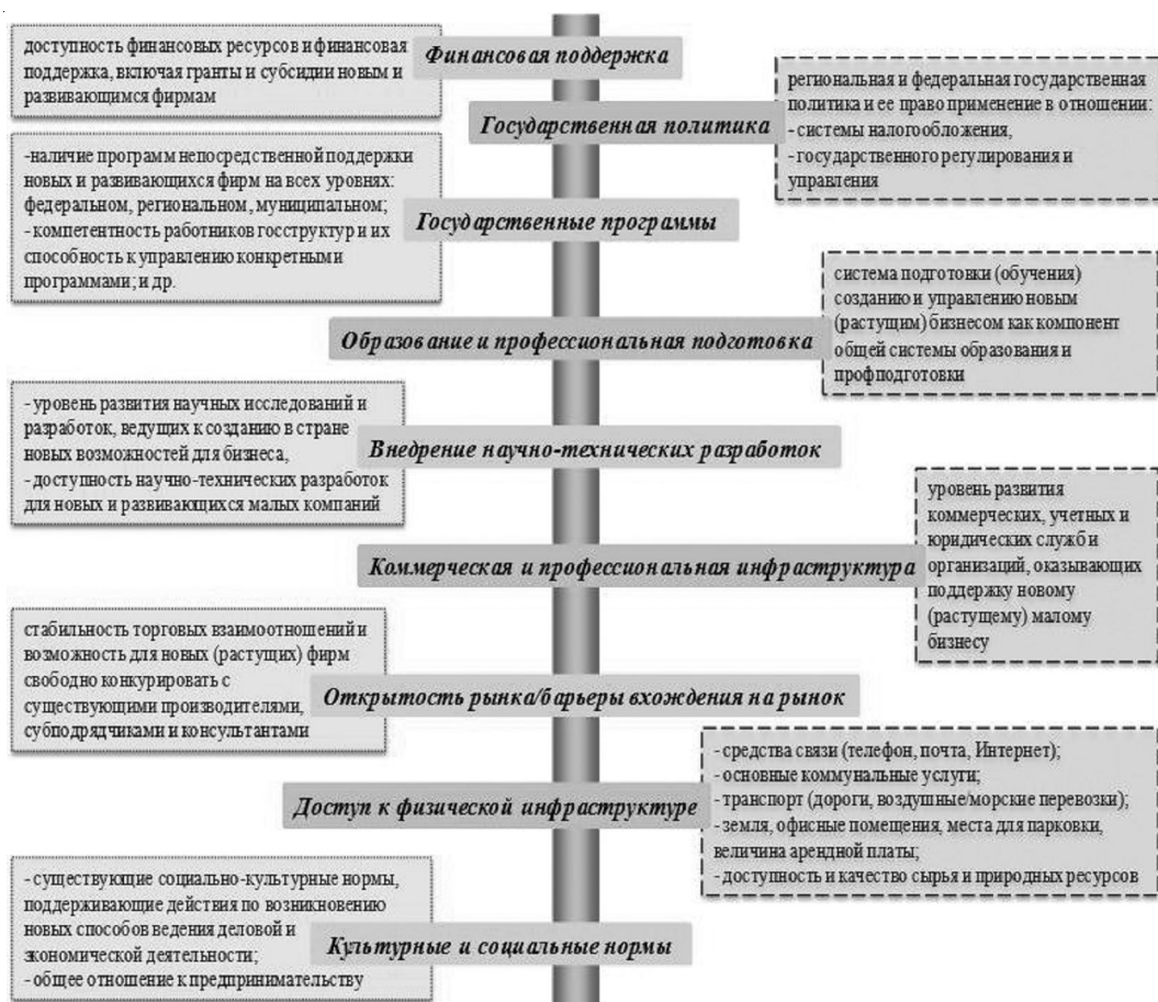
Рис. 2. Институциональное поле предпринимательства